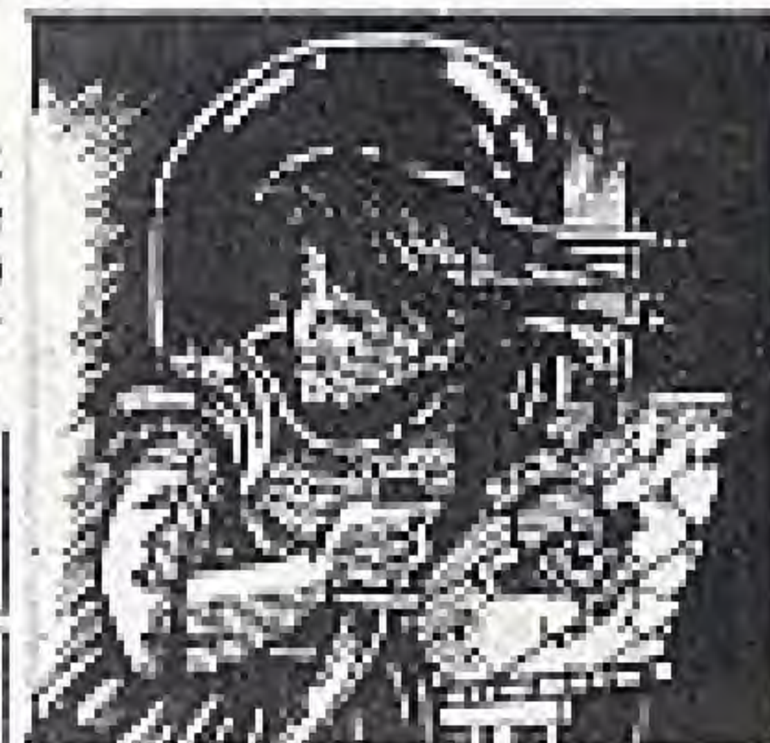
VALEVRIS IN COSTUME

Es wird eine große Aufgabe sein, mit diesen rasenden Amazonenkämpfern, die von der südlichen H Seite Trindor kommen, Schritt zu halten.